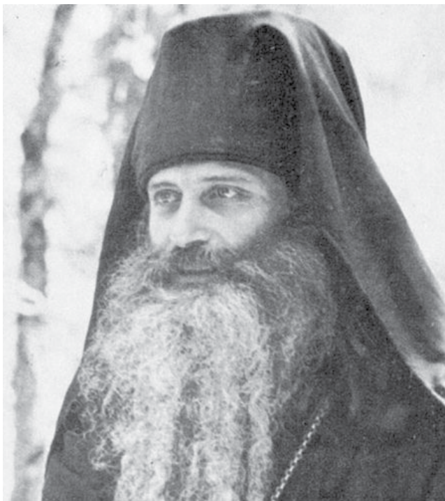
О. Серафим (Роуз)

Это новое поколение ученых вышло первоначально из так называемой «парижской школы» православной мысли, представителями ее были в основном русские интеллигенты. Еще в России многие из них (например, Петр Струве, переведший на русский «Капитал» Маркса) немало по-