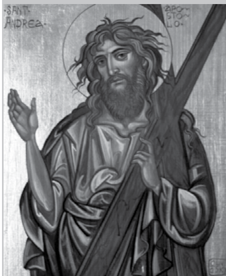
Тропарь апостолу Андрею Первозванному, глас 4

Яко апостолов первозванный/ и верховнаго сущий брат,/ Владыце всех, Андрее, молися,/ мир вселенней даровати// и ду-