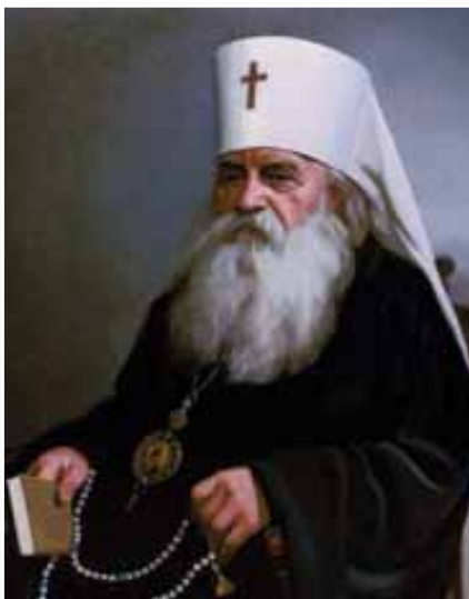
митрополит Антоний Храповицкий