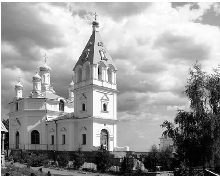
Владимирской иконы Божьей Матери храм, пгт. Кочеток

И вот мы, наконец, в Кочетке возле церкви. Дома мне она казалась маленькой, а теперь я вижу, какая она вблизи. Она еще краше, чем я представляла ее себе. Нежно-голубая с забором, обвитым виноградом. Да, человек, который спроектировал эту церковь, имел вкус. А само место для нее выбрано идеально. Красота неопишуемая, невольно думаешь о Создателе, а душа трепещет.