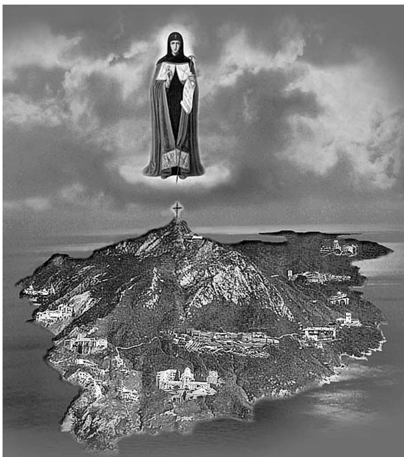
Никогда женская нога не ступала на святую гору Афон, – так повелела Божия Матерь, охраняя мир и покой монашествующих. Афон – одно из главных святых мест, земной удел Божией Матери

Монашеская жизнь – постоянное подражание Слову, Христу. Ревностный монах проходит все ступени жизни Христа. В нем распинается Христос, чудотворствует, претерпевает скорбь, воскресает, возносится... Поскольку в нем – Христос, ему удастся объединить свой внутренний мир с внешним. Он преодолевает все границы и восходит на большую высоту, чем та, с которой ниспал Адам. Святой Мак-